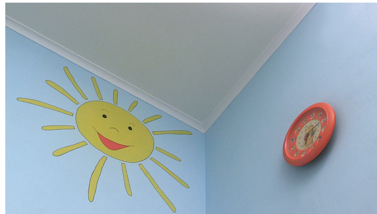
Soffitto decorato con Go paint Stellare con attrezzo nuvola. Effetto alla luce